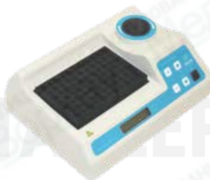
Термостат TAGLER для пробирок модель НТ-120