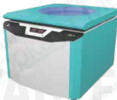
Центрифуга лабораторная молочная с подогревом TAGLER модель ЦЛМН 1-8