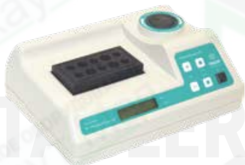
Термостат TAGLER для пробирок модель НТ- Plasmolifting Gel