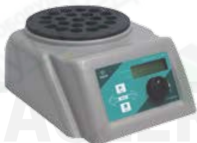
Термостат TAGLER для пробирок модель НТ-170 ХПК