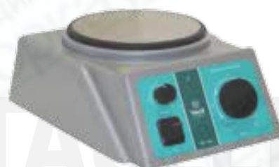
Мешалка магнитная TAGLER модель ММ 135 Н