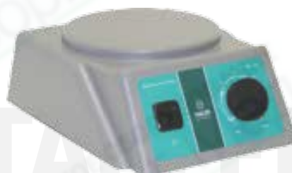
Мешалка магнитная TAGLER модель ММ 135