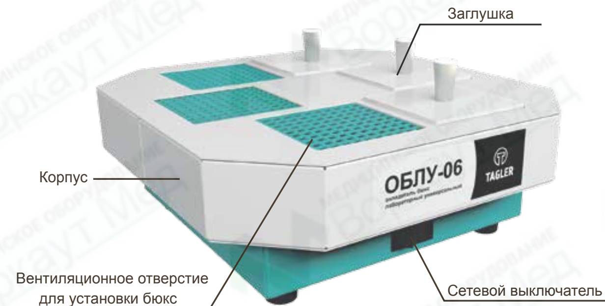
Общий вид прибора